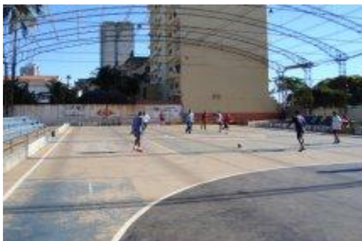
Figura 11: Perdas/degradação dos espaços esportivos na Cidade de Maputo. Fonte: Arquivo pessoal. (2008).

Com relação aos espaços da mídia, especialmente na mídia televisiva, ainda que identifiquemos nos quadros de análise de programação, um aumento nos espaços de notícias sobre o esporte, entre os anos de 2003 e 2008, levantamos ainda algumas questões, visto que esse aspecto não é tão perceptível aos sujeitos envolvidos no estudo. Esses ainda que indiquem um progresso da mídia, em relação à abertura política trazida pelo processo de independência, são claros ao apontar que no sentido do esporte esse processo não é identificado.