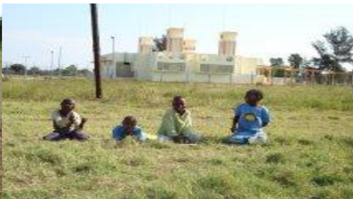
Figura 9: Campo de Futebol SONEF/ Província de Maputo.