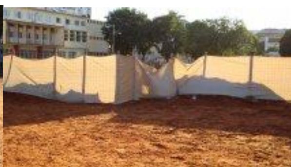
Figura 7: Campo USTM/ Maputo.