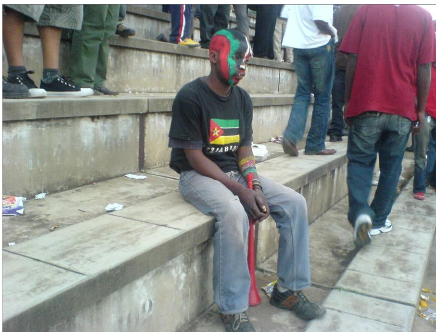
Figura 5: Jovem no Estádio da Machava. Fonte: Acervo pessoal (2008).

Por outro lado, Pires (2005) conceitua cultura esportiva como uma diversidade de traços identitários comuns, especialmente quanto à lógica de sua produção e de transmissão integradas na cultura contemporânea através de um conjunto de ações, valores e compreensões que representam o modo predominante de ser/estar na sociedade globalizada no campo esportivo.