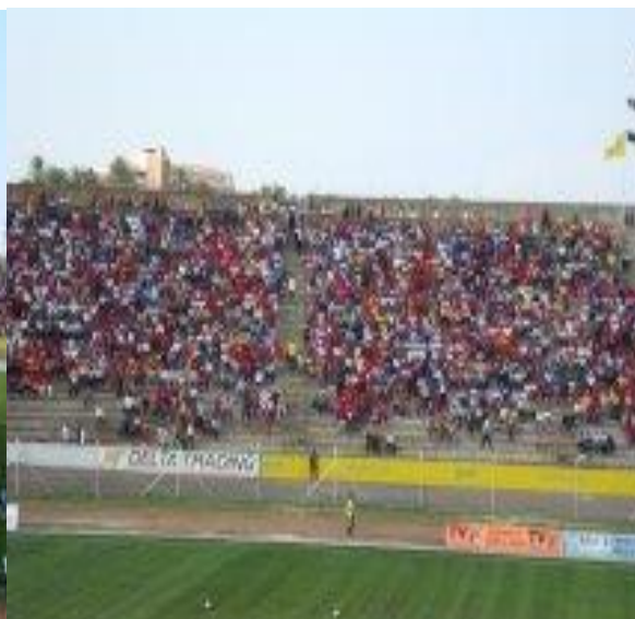
Figura 4: Estádio da Machava/Moçambique.