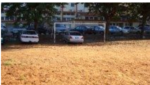
Figura 6: Campo USTM/ Maputo.