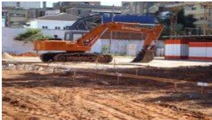
Figura 10: Perdas/degradação dos espaços esportivos na Cidade de Maputo. (2008).

Cultura compreendida no seu sentido mais amplo vivenciada no “tempo disponível” é fundamental como traço definidor, o caráter “desinteressado” dessa vivencia. Não se busca, pelo menos basicamente, outra recompensa além da satisfação provocada pela situação.