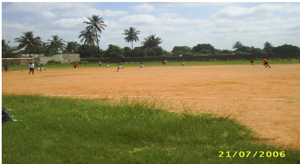
Figura 2: Província de Maputo - Campo de Futebol - Matola.

Contudo a influência da cultura esportiva na perspectiva do desenvolvimento humano promovida pela mídia poderia ser uma forma de intervenção no combate à pobreza absoluta.