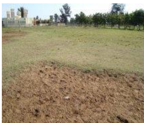
Figura 8: Campo de Futebol SONEF

O espaço do SONEF está situado nas proximidades da auto-estrada que liga Maputo - Wittbank, ficando próximo a uma estação de venda e produção de carvão. Também é possível identificar casas de alvenaria em seu redor. Assim como também comércio de bares e oficinas auto-mecânicas. Não há nenhum controle dos frequentadores do espaço e o grau de conservação é ruim. Não apresenta paredes com pichações , nem material impresso fixado. O grau de limpeza da área é precário, não existindo pessoa responsável pela área de vestiário/banheiro. Estes banheiros são pequenos e com um aspecto ruim de conservação e limpeza. Em geral os frequentadores costumam jogar uniformizados, sendo frequente a disputa amadora entre equipes que se encontram semanalmente aos finais de semana neste local, já que o espaço é usado por várias comunidades próximas. Aqui os convívios são rotativos, pois se realizam sempre no final de cada mês e sempre na casa de um dos EL, também aqui regada de cerveja e discussões sobre o esporte nacional e internacional. A faixa etária dos frequentadores desse espaço é em sua maioria de jovens e adultos que dividem o espaço para jogos de futebol e ocupando o campo as equipes que chegarem primeiro ao local.