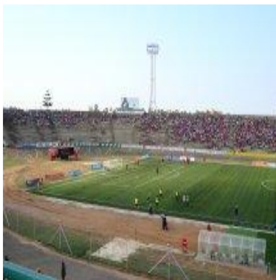
Figura 3: Estádio da Machava/Moçambique.

Dentro desse contexto, o esporte passou a ser tratado como um “direito de cada um”, esta classificação reflete a preocupação com a inclusão humano-social. Por isso, é merecedora de políticas que, embora específicas, perpassam todas as dimensões sociais. A preocupação com o humano/social deve estar, portanto, na escola, na recreação, assim como no esporte de alto rendimento.