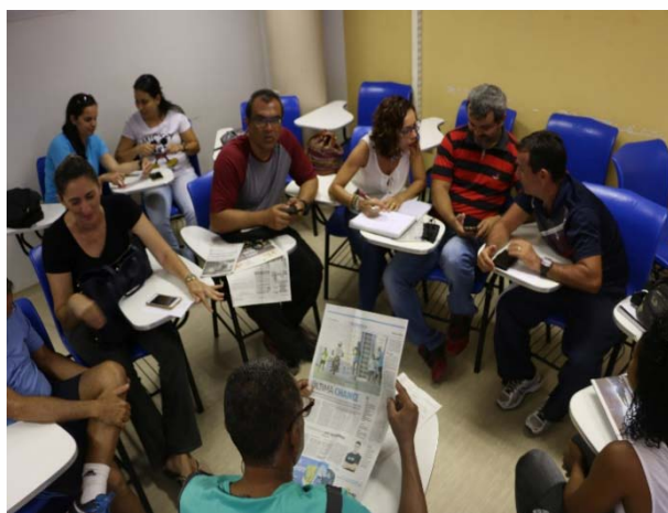
Professores da rede municipal: análise crítica e construção da mídia.

A Aproximação com a escola, quebrando os muros que separam a Universidade deste ambiente é essencial para que pensemos em ações conjuntas para formação humana. Neste sentido, um caminho importante é a formação continuada dos profissionais que estão na “linha direta” com as crianças e jovens em formação. As experiências em mídia-educação que envolve a relação Universidade-escola demonstram que é imprescindível e cada vez mais urgente, mantermos este elo. Portanto, continuemos pensando (reflexão crítica), continuemos agindo (apropriação criativa e crítica) e continuemos produzindo mídia..., com responsabilidade!