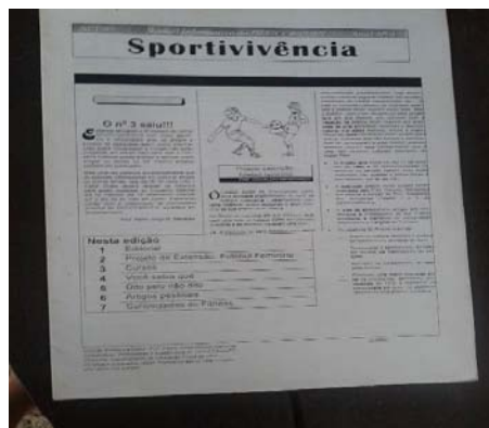
Sportivivência: Jornal Informativo do DEF/CCBS/UFS. Ano 1, nº 3. set/97

XX CONBRACE – Congresso Brasileiro de Ciências do Esporte 17 a 21 de setembro de 2017 UFG – Goiânia/GO https://www.facebook.com/contaconbrace2017/?fref=ts