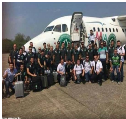
Última foto da delegação da chapecoense.