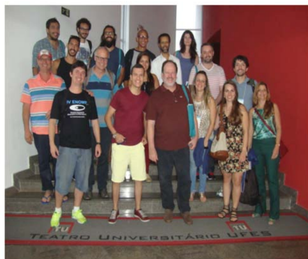
Foto: Membros do GTT-02 e do LaboMídia no CONBRACE/2015.